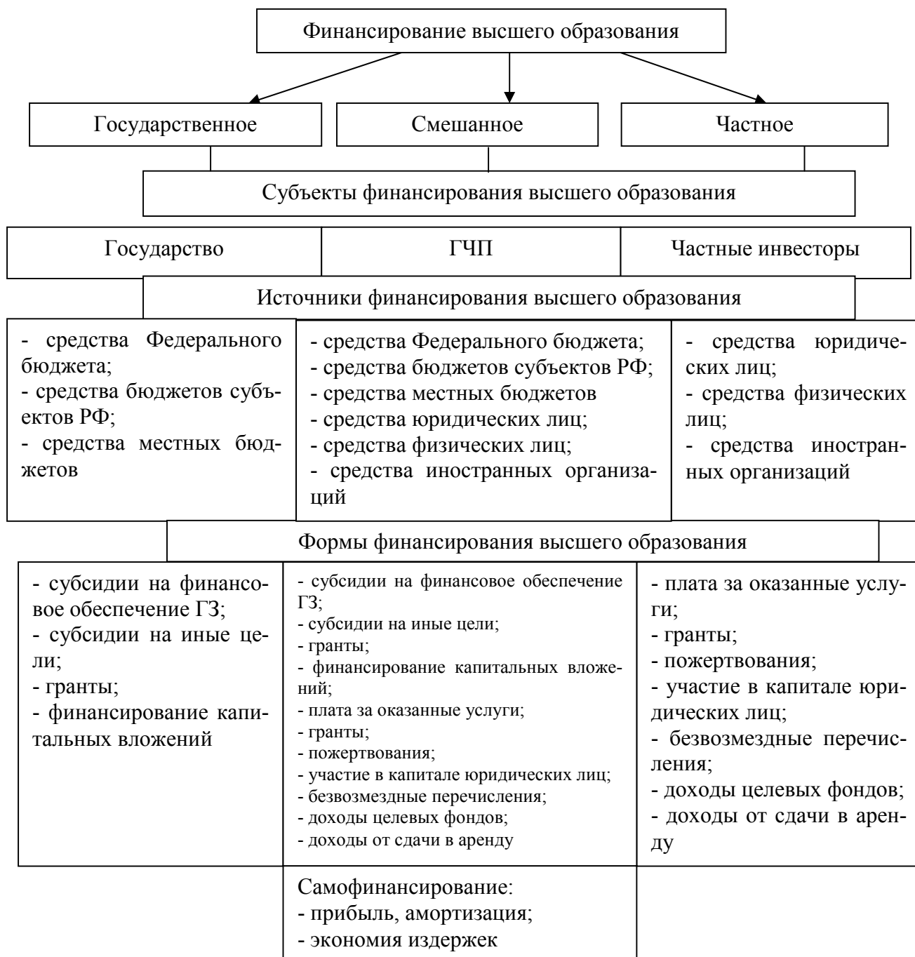
Рис 1. Финансирование высшего образования

это основной вид финансирования учреждений высшего образования. Государственное финансирование – это предоставление финансовых ресурсов за счет средств федерального и региональных бюджетов. Государственные образовательные учреждения могут финансироваться государством по нескольким формам: субсидии на финансовое обеспечение государственного задания; субсидии на иные цели; гранты; финансирование капитальных вложений в объекты государственной собственности [3].